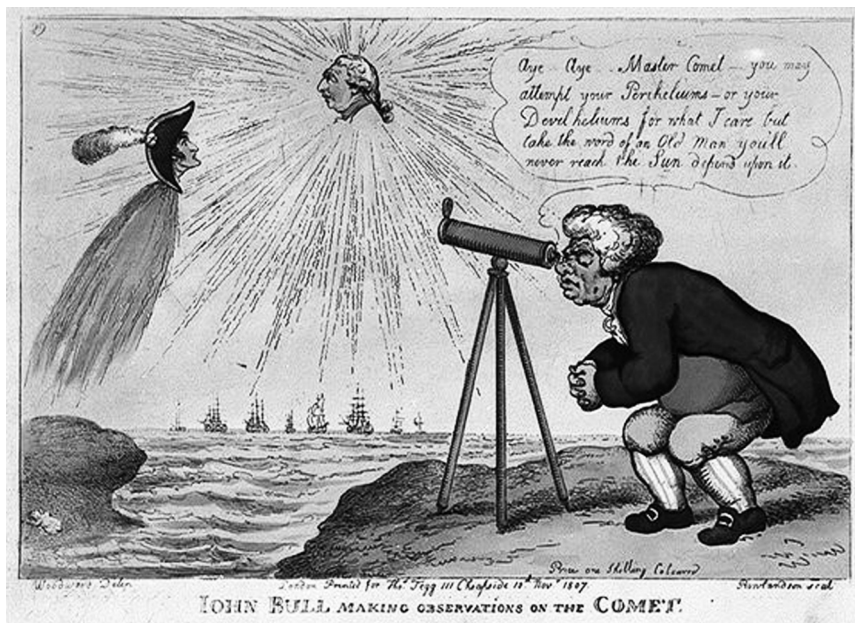
Карыкатура Томаса Роўлендсана.

Найбольш падрабязна пра ўспрыманне беларусамі падзей, звязаных з каметай 1811 г., напісаў Ігнат Яцкоўскі: "Напачатку таго лета з'явілася на небе камета, а на зямлі нечуваная раней засуха. Камета, велічынёю блізу паловы месяца, з'яўлялася штовечар з заходняга боку, нахіляючы свой хвост, які паўсюдна называлі мятлою, на поўнач. Вайна і пошасць меліся быць наступствамі гэтае з'явы. Кожны ўвечары выходзіў па-