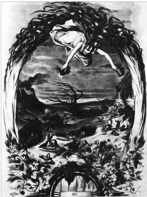
Камета 1811 г. Гравюра К. Матэса. 1857 г.

Астраном XIX ст. Каміль Фламарыён спрабаваў так растлумачыць містычны жах чалавека перад касмічнымі з’явамі: “Цікава заўважыць, што ўсё неспадзяванае і незвычайнае спараджае страх, а не радасць ці надзею. Таму ва ўсіх краінах, ва ўсе часы страшны выгляд каметы, цьмяны бляск яе галавы, яе раптоўнае з’яўленне на цвердзі нябеснай рабілі на людзей уражанне грознай сілы, нечага небяспечнага для ўсталяванага стагоддзі парадку ў свеце і прыродзе. А паколькі з’ява абмяжоўвалася заўсёды параўнальна невялікім прамежкам часу, то ўзнікала вера ў тое, што яе ўздзеянне павінна адбыцца амаль