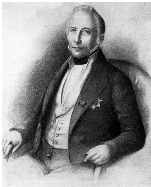
Вінцэнт Вішнеўскі, які апошнім з астраномаў назіраў комету 1811 г.

Томас Роўлендсан (Thomas Rowlandson), мастак, карыкатурыст і кніжны ілюстратар, вызна-