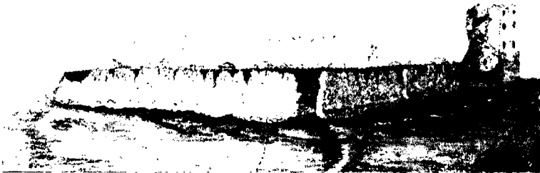
Ілюстрацыя 1. Крэўскі замак. Малюнак невядомага аўтара, сярэдзіна XIX ст. (?).

Гэтую ж сітуацыю са станам Крэўскага замка ў агульным паўтараюць малюнак і літаграфія Напалеона Орды. Мы бачым адносна добра захаваныя муры замка і разбурэнні Княскай вежы. Паводле малюнка Орды, быў разбураны не паўднёва-ўсходні кут, а паўднёва-ўсходняя сцяна вежы 12 .