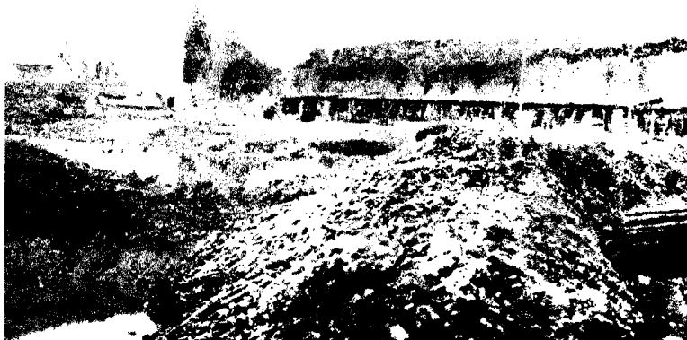
Ілюстрацыя 3. Руіны Крэўскага замка. Восень 1917 г. Выгляд з захаду (Наводне: Bilder aus den Kämpfen um Krewo – Smorgon. Breslau: Verlag Hiller, 1918; Rudolph K. Geschichte des Preußischen Landwehr-Infanterie-Regiments Nr. 3: nach d. dienstl. Kriegstagebüchern. Berlin, 1928.)

можа казаць пра персанальную адказнасць, то мы павінны яе ўскласці на тых, хто распачаў тую вайну.