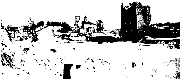
Ілюстрацыя 2. Кру́ўскі замак і Траецкая царква (былы касцёл). Выгляд з паўночнага захаду. Зіма 1915-1916. (Наводдзе: Krewo. Ein Jahr Stellungskampf. 1915-September 1916. Breslau, 1916.)

Усе тры гады пазіцыйнай вайны ў Крэве ўсё ж не зліюцца ў адзін працяглы дзень. Ёсць даты, якія расстаўляюць вехі падзей.