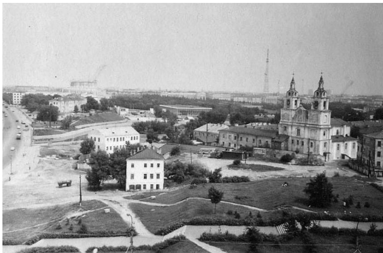
Лл. 21. Мінск, Верхні горад. Пагорак, па якім праходзіла вуліца Казьмадзям'янаўская (Дзям'яна Беднага) з ацалелымі будынкамі. Здымак 1968 г.

Для нас жа сюжэты з постаццю Каліноўскага, савецкім кінафільмам і старажытнай вуліцай павучальныя – усё ў нашай гісторыі павязана, і калі нехта паспрабуе з яе выкінуць нейкую частку, рызыкуе абваліць увесь дом. Але, прынамсі, наша памяць з гэтым не пагодзіцца.