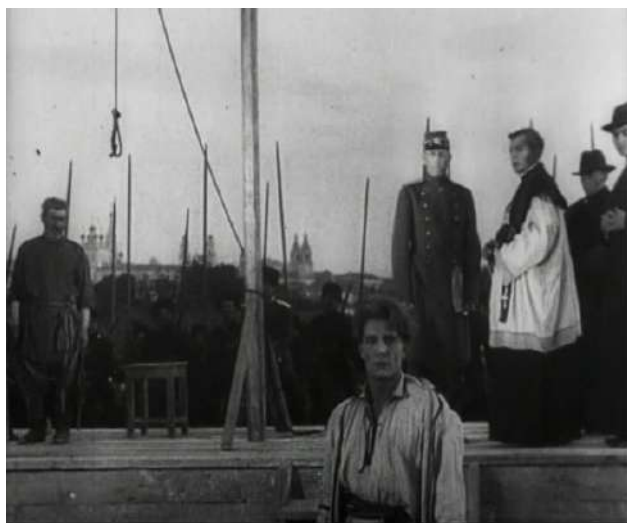
Іл. 9. Пакаранне Кастуся Каліноўскага. На заднім плане – характэрны архітэктурны краявід Верхняга рынку Мінска (кадр з фільма «Кастусь Каліноўскі»)

У драматургіі фільма адны з найбольш значных месцаў займаюць фінальныя сцэны смяротнага пакарання Каліноўскага (іл. 9). Як вядома, паўстанцкі правадыр быў публічна пакараны ў сакавіку 1864 г. на гандлёвым Лукішскім пляцы ў Вільні. Можна спрачацца пра выдатныя якасці Міхаіла Мураўёва як адміністратара, але нельга не прызнаць паталагічную схільнасць віленскага генерал-губернатара да павешванняў – вядома шмат выракаў ваенна-палявых судоў з вызначэннем пакарання ў якасці ссылкі ці расстрэлаў, якія Мураўёў метадычна замяняў на павешванні. Так і Каліноўскі быў прысуджаны да расстрэлу, а ўжо Мураўёў замяніў гэтае пакаранне на пятлю.