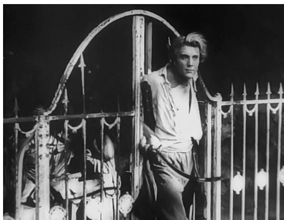
Іл. 5. Кастусь Каліноўскі (акцёр Мікалай Сіманаў) (кадр з фільма «Кастусь Каліноўскі»)