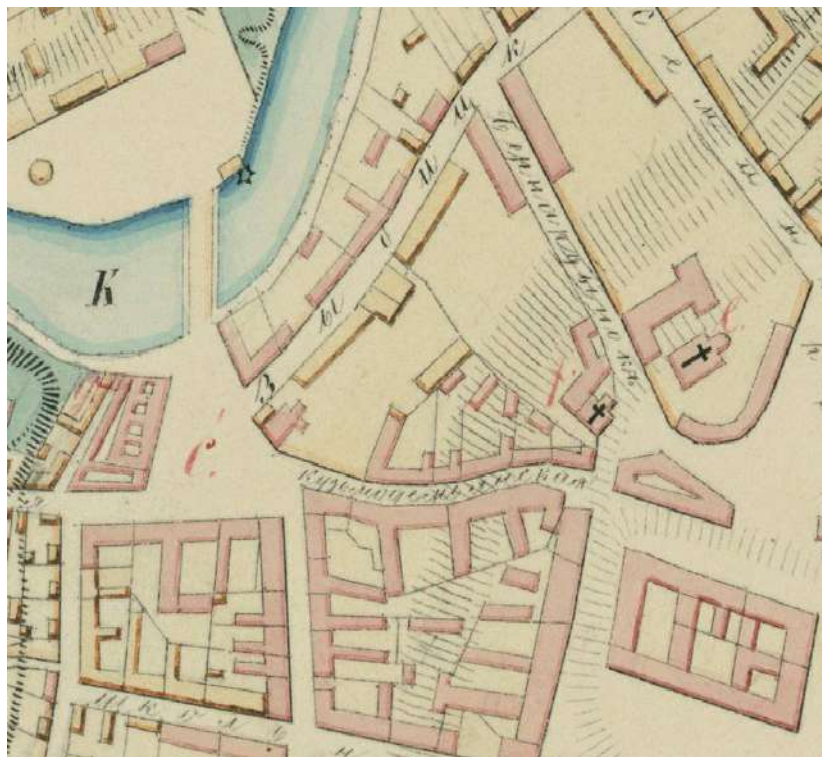
Іл. 12. Вуліца Казьмадзям'янаўская на плане Мінска 1858 г. (фрагмент) (Плань губернскага горада Мінска праэктнага віда. РГИА. Ф. 1293. Оп. 167. Д. 5. Л. 1; Мінск на старадаўніх картах і планах / І. Андрэеў, В. Андрэева, П. Растоўцаў. Мінск, 2021. С. 106–107)

на пагорку – прыблізна на тым месцы, дзе ў 1633 г. новапрызначаным менскім ваяводам Аляксандрам Слушкам будзе фундаваны кляштар бернардынак 1 . Слушка перайшоў з кальвінства ў каталіцтва, таму фундацыя каталіцкага кляштару ў ягонай ваяводскай сталіцы мела, апроч іншага, сімвалічнае значэнне.