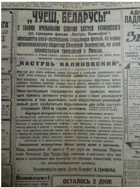
Іл. 10. Абвестка пра набор масоўкі для здымак сцэны смяротнага пакарання Кастуся Каліноўскага (Звезда, 1927, 29 ліпеня)