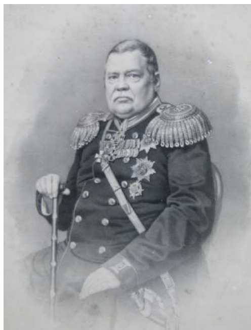
Іл. 8. Граф Міхаіл Мікалаевіч Мураўёў (Віленскі). Папера, літаграфія, 72 × 54,5 см. Літограф Павел Смірноў (Санкт-Пецярбург, Рэдакцыя Російскай художественной хроники, 1865) (Государственный исторический музей (Москва). Отдел/коллекция: Изобразительные материалы / Печатная графика. Инв. номер: И Ш 22767. Номер ГИМ: ГИМ 42949/3522. Номер ГК: 33694442)

Пракатны лёс стужкі ў жніўні 1928 г. (выпуск 14.08.1928) у Мінску быў, як вынікае з тагачаснай прэсы, вельмі ўдалым 1 . Праз тыдзень прэса ўжо адзначала: «Мінск не памятае такога поспеху! 2 тыдні поўных збораў, 40 перапоўненых сеансаў. Рэкорд наведвальнасці карціны» 2 .