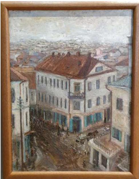
Іл. 14. Анатоль Тычына. Стары Мінск. Казьмадзям'янаўская вуліца. 1930. Палатно, алей. 70,3 × 52,5 см. Нацыянальны мастацкі музей Рэспублікі Беларусь