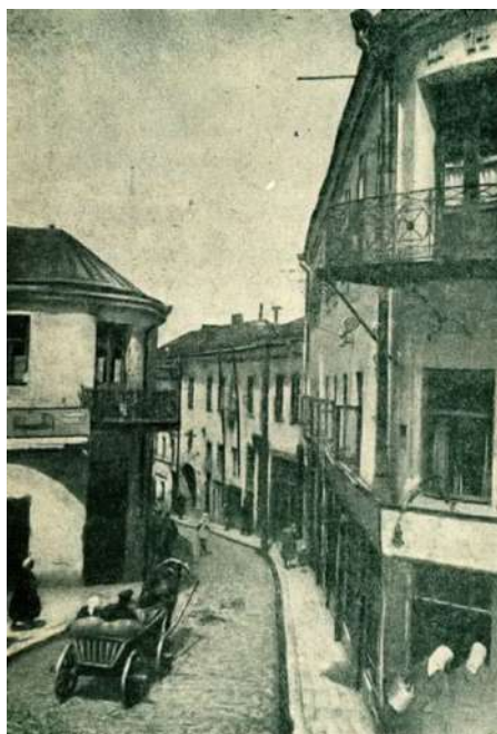
Іл. 17. Вул. Казьмадзем'янаўская (Францыска Скарыны). Здымак Льва Дашкевіча (Чырвоная Беларусь. 1930, № 1). Менавіта тут у фільме «Кастусь Каліноўскі» народнага героя везлі на пакаранне