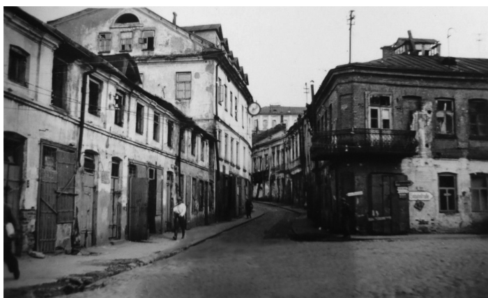
Іл. 19. Ацалелая частка Казьмадзям’янаўскай вуліцы (Дзям’яна Беднага). 1941 (?)