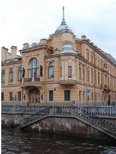
Іл. 2. Будынак фабрыкі «Белдзяржкіно» ў 1927–1939 гадах (Санкт-Пецярбург, канал Грыбаедава, 90/2)