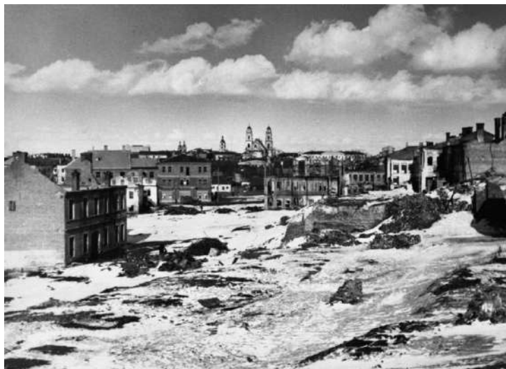
Іл. 20. Мінск пасля бамбавання. Наперадзе – раён Ніжняга рынку і вуліцы Казьмадзям’янаўскай. Здымак 1941 (1943?)

Вядома, ступень пашкоджанняў ці разбурэнняў будынкаў можна ацэньваць па-рознаму. У паваянным Мінску больш-менш значныя пашкоджанні будынкаў трактаваліся на карысць іх поўнага знішчэння, а не адбудовы. Усё ж, нават пасля разбору завалаў пасля заканчэння вайны, якая так знявечыла наш горад, ад колішняй Казьмадзям’янаўскай засталася тры функцыянальных будынкi 1 . Таксама, афіцыйна захоўваліся адрасы па вуліцы Дзям’яна Беднага – ацалелы трохпавярховы будынак XVIII ст., які сваім фасадам выходзіў на Ніжні рынак (пл. 8 Сакавіка), меў нумарацыю дома № 8 па вул. Дзям’яна Беднага (іл. 21) 2 . Але гэтыя тры апошнія будынкi колішняй Казьмадзям’янаўскай былі канчаткова разбураны ў 1989 г. у сувязі з будаўніцтвам тунелю метро і станцыі «Няміга» 3 .