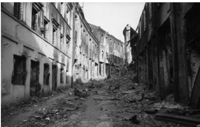
Іл. 18. Пашкоджаная забудова Казьмадзям’янаўскай вуліцы (Дзям’яна Беднага).

Вуліца моцна пацярпела падчас нямецкіх бамбаванняў у чэрвені 1941 г., пра што сведчаць і здымкі таго часу 2 (іл. 18–20). Большасць будынкаў вуліцы панесла значныя страты, як і 80 % усяго даваеннага жыллёвага фонду Мінска 3 .