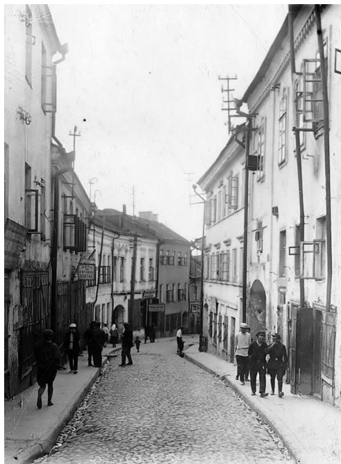
Іл. 13. Вуліца Казьмадзям'янаўская (Францэўска Скарыны). Здымак 1931 г.

ліцы – ад так званага Малога Гасціннага двара. Праўда, гэтая праца яшчэ з 1960-х гадоў не фігуравала ў спісе асноўных твораў мастака 5 , а таксама не ўключалася ў экспанаты персанальных выстаў А. Тычыны 6 . Сёння ж карціна «Стары Мінск. Казьмадзям'янаўская вуліца» выстаўлена ў сталай экспазіцыі Нацыянальнага мастацкага музея Рэспублікі Беларусь.