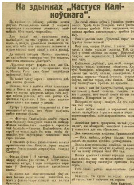
Іл. 11. Рэпартаж Якіма Садоўскага «На здымках “Кастуся Каліноўскага”» (Савецкая Беларусь. 1927, 2 жніўня, № 173. С. 4)

засцерагаючыся паграмаў. Гучыць неверагодна, але ў другой палове двацца- тых гадоў практычна ўсе апісаныя рэаліі Мінска яшчэ існавалі – былі крамкі, даўняя забудова, каваныя краты на гаўбцах, габрэі ў крамах... У той час, калі здымалі фільм, дэкарацыі не спатрэбіліся.