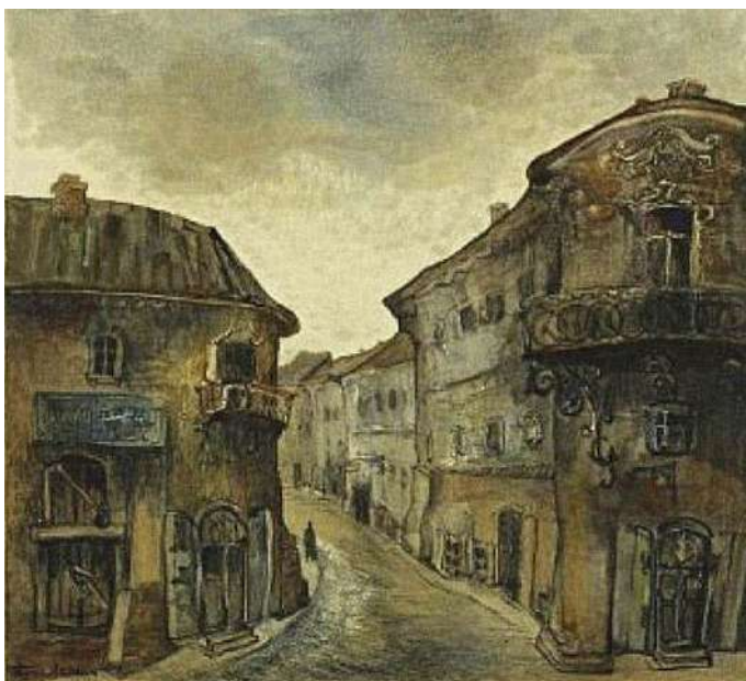
Іл. 16. Барыс Малкін. Стары Мінск. Афорт. 1939. Дзяржаўны музей выяўленчых мастацтваў імя А. С. Пушкіна